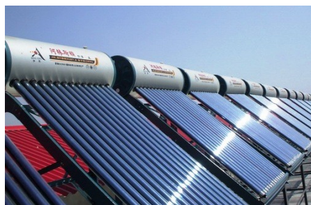
Calidad del colector Solar de agua (CSA)

Gobiernos: Políticas de fomento efectivas y confiables